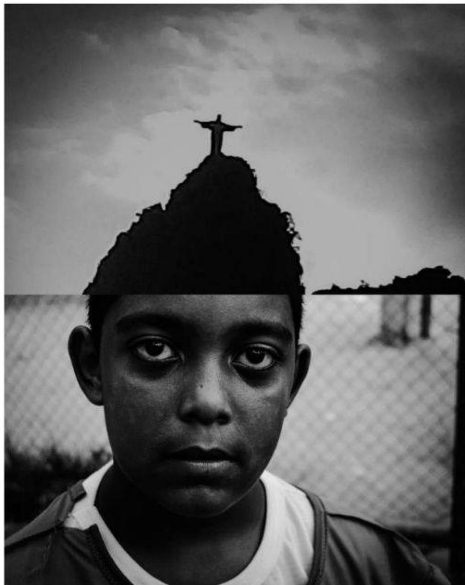
Imagem: Série "O que sustenta o Rio?" (2019) Joellington Rios @rivers_____